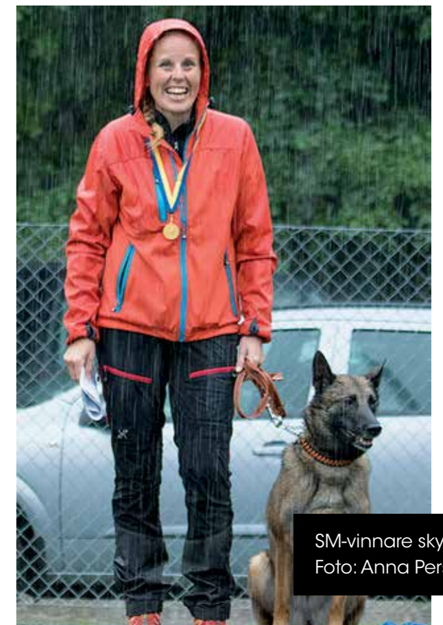
SM-vinnare skydd

Konferens för distriktens utbildningsansvariga hölls 22-23 oktober i Sollentuna.