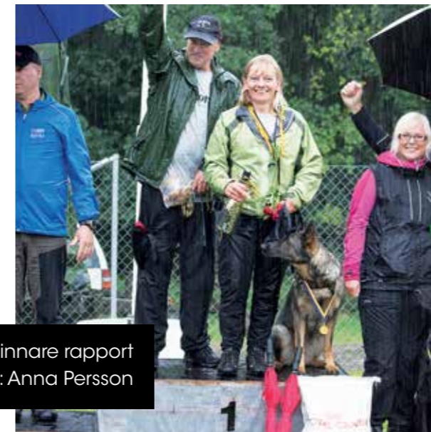
SM-vinnare rapport

2015 tog förbundsstyrelsen beslut att utveckla en ny grafisk profil för förbundet, något som inte gjorts sedan 2007. Kommunikationsbyrån Rehn & co anlätades för arbetet. Första steget i arbetet blev en renodling av logotypen som förbundsstyrelsen ämnar lägga fram som förslag till kongressen 2017. I arbetet ingick även utveckling av nya mallar och en grafisk manual.