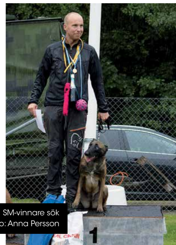
SM-vinnare sök