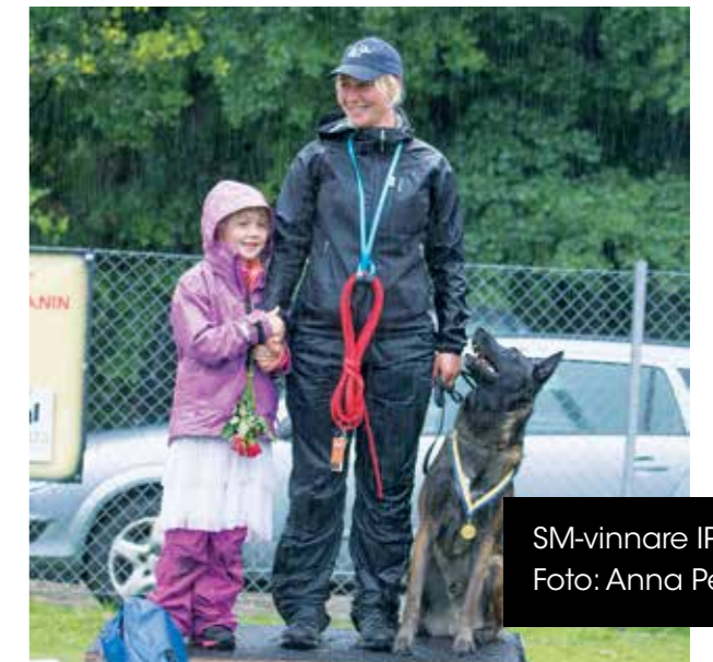
SM-vinnare IPO