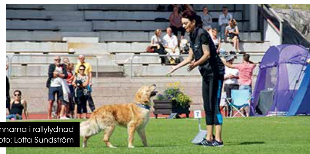
SM-vinnarna i rallylydnad