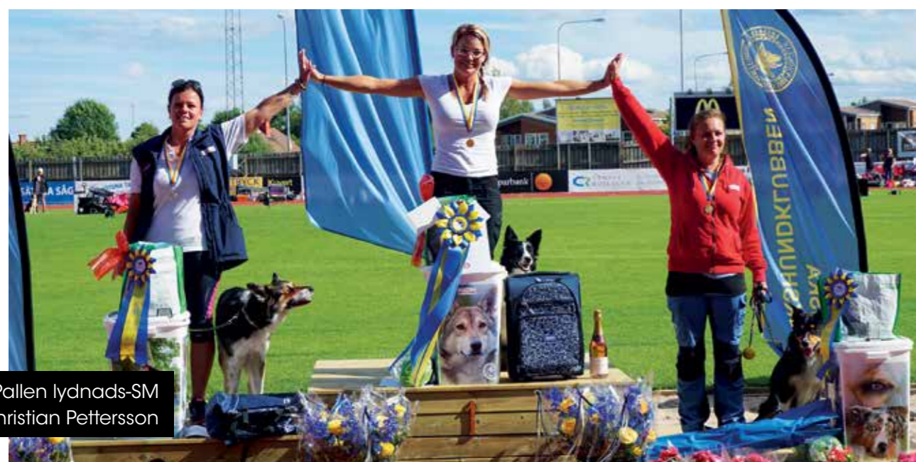
Pallen lydnads-SM

Lagresultat i VM: Tredje plats i lydnad, tredje plats i IPO-R ytsök, fjärde plats i IPO-R ruinsök.