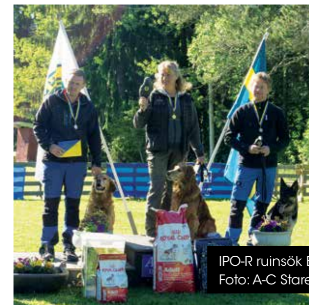
IPO-R ruinsök B