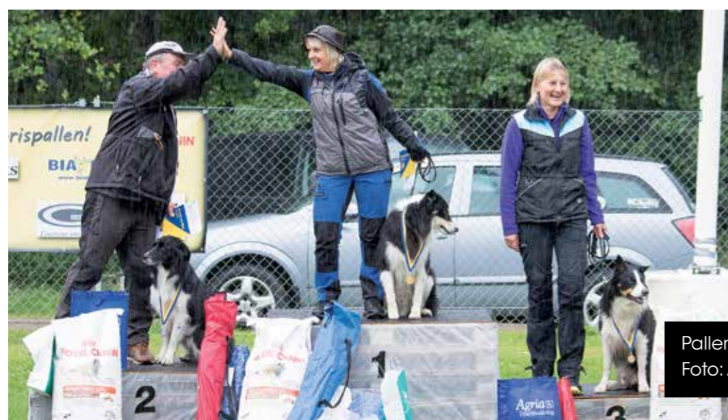
Pallen SM i spår