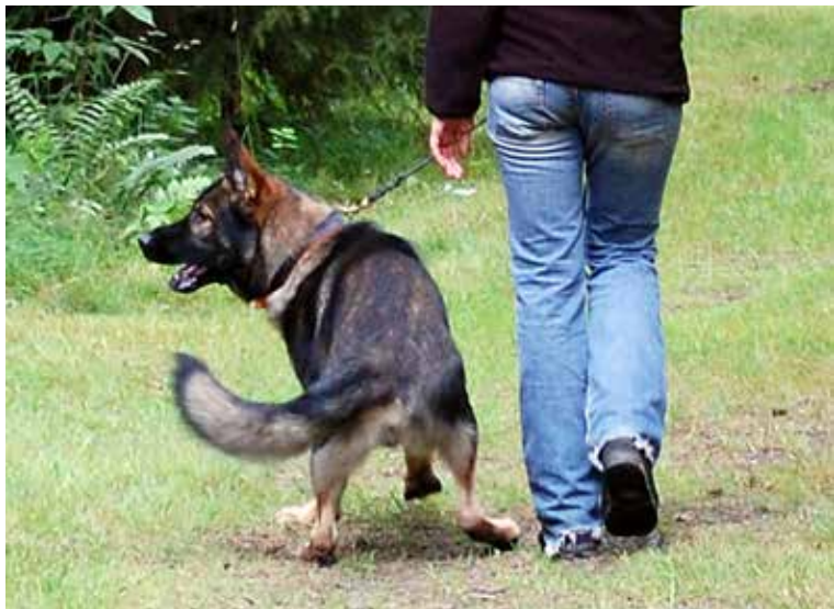
Hunden reagerar under momentet ljudkänslighet

Efter genomförd beskrivning får hundägaren en kopia av protokollet som bevis för att hunden har känd mentalstatus. Originalet skickas via Brukshundklubben till Svenska Kennelklubben (SKK) för registrering och förs in på SKK hunddata.